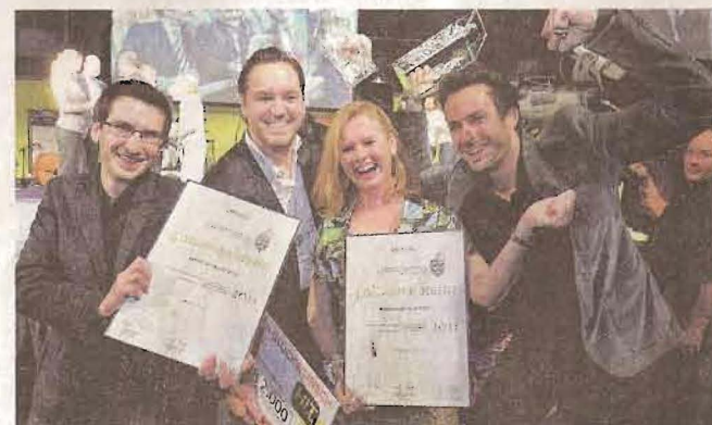
Freude bei der agentur werbereich, Sieger in Kategorie Website