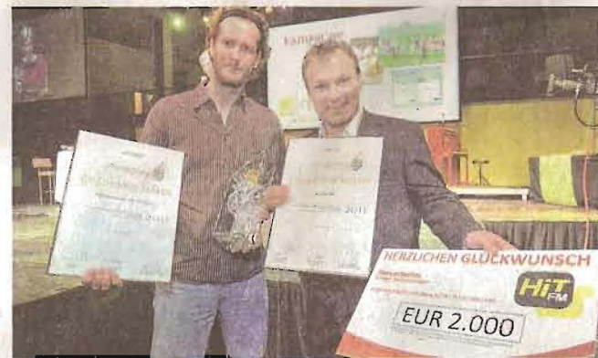
Sieger der Kategorien Kampagne und Verpackungsdesign: Heavystudios

Alle Nominierten und Sieger finden sich online unter www.goldenerhahn.or.at